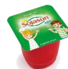
Sojasun kids fraise 24x90g