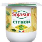
Sojasun citron 24x100g