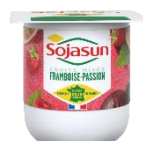
Sojasun framboise passion 24x100g