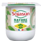
Sojasun nature 24x100g