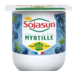
Sojasun myrtilles 24x100g