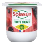
Sojasun fruits rouges 24x100g