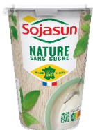
Sojasun nature 6x500g