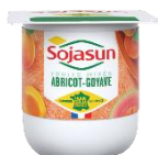
Sojasun abricot - goyave 24x100g